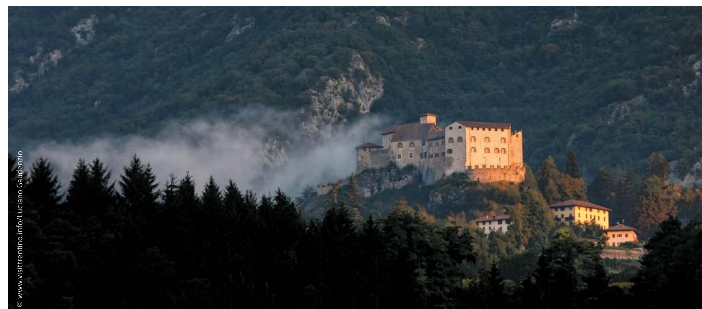
Nei castelli e nelle rocche riviverete con l'intera famiglia l'emozionante storia di sovrani, damigelle e cavalieri, come per esempio a Castel Stenico in Trentino.