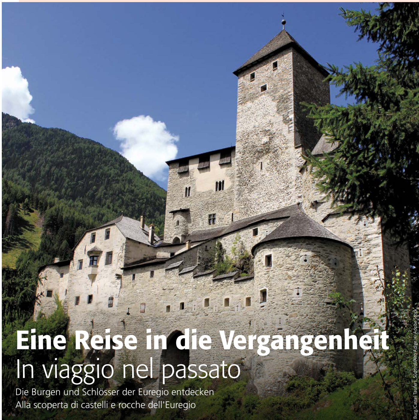
Burg/Castel Taufers, Südtirol/Alto Adige