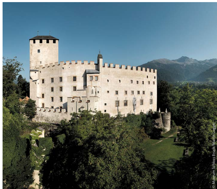
In den Burgen und Schlössern erkundest du gemeinsam mit deiner Familie die aufregende Geschichte von Herrscherinnen und Herrschern, von Burgräuleins und Rittern, wie beispielsweise im Schloss Bruck in Osttirol.

Schon immer hatten Tirol, Südtirol und Trentino vieles gemeinsam und kooperierten in verschiedenen Bereichen. Vor zehn Jahren haben sie sich offiziell zur „Europaregion Tirol-Südtirol-Trentino“ zusammenschlossen und eine Vielzahl an Projekten gestartet. Damit du gemeinsam mit deiner Familie die Vielfalt der Region unkompliziert kennenlernen kannst, gibt es seit 2017 den EuregioFamilyPass, mit dem ihr mit einer einzigen Karte in allen drei Ländern über 1.000 Vorteile nutzen könnt. Die zahlreichen Einrichtungen aus den Bereichen Freizeit, Kultur, Handel und Dienstleistung bieten familienfreundliche Angebote, Aktionen und Vergünstigungen. So können du und deine Familie eure Freizeit abwechslungsreich und aufregend gestalten. Unter anderem zählen