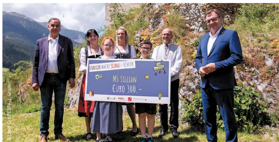
Die erste „Euregio macht Schule“-Auszeichnung durch Euregio-Präsident Günther Platter in Osttirol. La prima premiazione del progetto "Euregio fa scuola" consegnato dal Presidente dell'Euregio Günther Platter in Tirol dell'Est.

Seit dem letzten Jahr gibt es das Euregio-FamilyPass Malbuch, mit dem du dich auf eine malerische Entdeckungstour durch Tirol, Südtirol und das Trentino aufmachen kannst. Hier erfährst du vieles über Geografie, Kultur und Geschichte der drei Länder und kannst richtig kreativ sein. Eine Vorlage zum Ausmalen findest du auf der rechten Seite. Das Malbuch zum Herunterladen und weitere Informationen gibt es unter www.familypass.eu